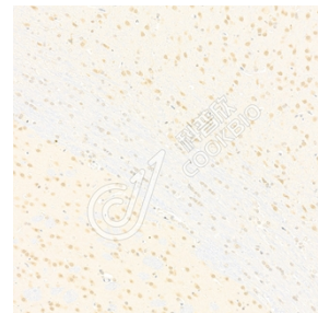
IHC 检测 KAT5/Tip60 蛋白(货号 K1333195). 样品: 大鼠脑, 4%多聚甲醛(货号 KSG1101) 固定 12-24 小时. 抗原修复: 柠檬酸抗原修复液(干粉, pH 6.0) (KSG1201), 98°C, 20 分钟. 一抗: 1: 1800 稀释, 4°C 孵育过夜. 二抗: S-vision 免疫组化多聚二抗(山羊抗兔), 即用型(货号 KB3906), 室温孵育 20 分钟.