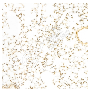
IHC 检测 Mad2L1 蛋白(货号 K1333555). 样品: 小鼠肺, 4%多聚甲醛 (货号 KSG1101) 固定 12-24 小时. 抗原修复: 柠檬酸抗原修复液(干粉, pH 6.0) (KSG1201), 98°C, 20 分钟. 一抗: 1: 1800 稀释, 4°C 孵育过夜. 二抗: S-vision 免疫组化多聚二抗(山羊抗兔), 即用型 (货号 KB3906), 室温孵育 20 分钟.