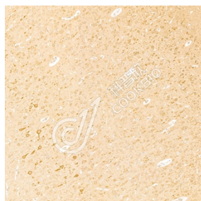
IHC 检测 TRPC3 蛋白(货号 K1333621). 样品: 大鼠脑, 4%多聚甲醛 (货号 KSG1101) 固定 12-24 小时. 抗原修复: 柠檬酸抗原修复液(干粉, pH 6.0) (KSG1201), 98°C, 20 分钟. 一抗: 1: 2500 稀释, 4°C 孵育过夜. 二抗: S-vision 免疫组化多聚二抗(山羊抗兔), 即用型 (货号 KB3906), 室温孵育 20 分钟.