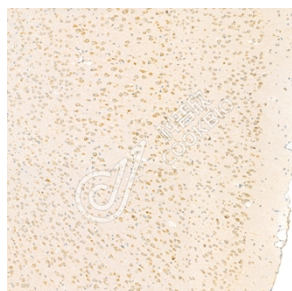
IHC 检测 Chromogranin A 蛋白(货号 K1333948). 样品: 小鼠脑, 4%多聚甲醛 (货号 KSG1101) 固定 12-24 小时. 抗原修复: 柠檬酸抗原修复液(干粉, pH 6.0) (KSG1201), 98°C, 20 分钟. 一抗: 1: 2500 稀释, 4°C 孵育过夜. 二抗: S-vision 免疫组化多聚二抗(山羊抗兔), 即用型 (货号 KB3906), 室温孵育 20 分钟.