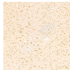
IHC 检测 Chromogranin A 蛋白(货号 K1333948). 样品: 大鼠脑, 4%多聚甲醛 (货号 KSG1101) 固定 12-24 小时. 抗原修复: 柠檬酸抗原修复液(干粉, pH 6.0) (KSG1201), 98°C, 20 分钟. 一抗: 1: 2500 稀释, 4°C 孵育过夜. 二抗: S-vision 免疫组化多聚二抗(山羊抗兔), 即用型 (货号 KB3906), 室温孵育 20 分钟.