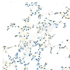
IHC 检测 Translin/TSN 蛋白(货号 K1335865). 样品: 大鼠肺, 4%多聚甲醛 (货号 KSG1101) 固定 12-24 小时. 抗原修复: Tris-EDTA 抗原修复液(pH 9.0) (KSG1203), 98°C, 20 分钟. 一抗: 1: 900 稀释, 4°C 孵育过夜. 二抗: S-vision 免疫组化多聚二抗(山羊抗兔), 即用型 (货号 KB3906), 室温孵育 20 分钟.