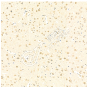
IHC 检测 PGBD5 蛋白(货号 K1336882). 样品: 小鼠脑, 4%多聚甲醛 (货号 KSG1101) 固定 12-24 小时. 抗原修复: Tris-EDTA 抗原修复液(pH 9.0) (KSG1203), 98°C, 20 分钟. 一抗: 1: 4000 稀释, 4°C 孵育过夜. 二抗: S-vision 免疫组化多聚二抗(山羊抗兔), 即用型 (货号 KB3906), 室温孵育 20 分钟.