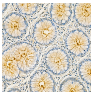
IHC 检测 CEACAM1 蛋白(货号 K5456879). 样品: 人结肠癌, 4%多聚甲醛 (货号 KSG1101) 固定 12-24 小时. 抗原修复: 柠檬酸抗原修复液(干粉, pH 6.0) (KSG1201), 高压锅均匀喷气计时 2 分钟. 一抗: 1: 800 稀释, 4°C 孵育过夜. 二抗: S-vision 免疫组化多聚二抗(山羊抗兔), 即用型 (货号 KB3906), 室温孵育 20 分钟.