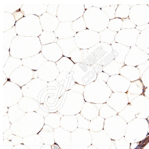
IHC 检测 SFRP5 蛋白(货号 K1343938). 样品: 小鼠白色脂肪, 4%多聚甲醛 (货号 KSG1101) 固定 12-24 小时. 抗原修复: 柠檬酸抗原修复液(干粉, pH 6.0) (KSG1201), 98°C, 20 分钟. 一抗: 1: 1100 稀释, 4°C 孵育过夜. 二抗: S-vision 免疫组化多聚二抗(山羊抗兔), 即用型 (货号 KB3906), 室温孵育 20 分钟.