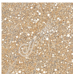
IHC 检测 SHCBP1 蛋白(货号 K1345177). 样品: 人肝癌, 4%多聚甲醛 (货号 KSG1101) 固定 12-24 小时. 抗原修复: Tris-EDTA 抗原修复液(pH 9.0) (KSG1203), 98°C, 20 分钟. 一抗: 1: 1300 稀释, 4°C 孵育过夜. 二抗: S-vision 免疫组化多聚二抗(山羊抗兔), 即用型 (货号 KB3906), 室温孵育 20 分钟.