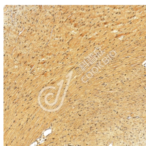
IHC 检测 HOXD11 蛋白(货号 K1345186). 样品: 小鼠心, 4%多聚甲醛 (货号 KSG1101) 固定 12-24 小时. 抗原修复: Tris-EDTA 抗原修复液(pH 9.0) (KSG1203), 98°C, 20 分钟. 一抗: 1: 1300 稀释, 4°C 孵育过夜. 二抗: S-vision 免疫组化多聚二抗(山羊抗兔), 即用型 (货号 KB3906), 室温孵育 20 分钟.