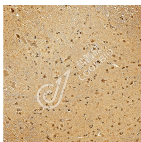
IHC 检测 SHQ1 蛋白(货号 K1345222). 样品: 小鼠脊髓, 4%多聚甲醛 (货号 KSG1101) 固定 12-24 小时. 抗原修复: Tris-EDTA 抗原修复液(pH 9.0) (KSG1203), 98°C, 20 分钟. 一抗: 1: 1300 稀释, 4°C 孵育过夜. 二抗: S-vision 免疫组化多聚二抗(山羊抗兔), 即用型 (货号 KB3906), 室温孵育 20 分钟.