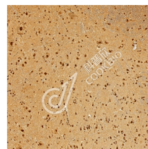
IHC 检测 SHQ1 蛋白(货号 K1345222). 样品: 大鼠脊髓, 4%多聚甲醛 (货号 KSG1101) 固定 12-24 小时. 抗原修复: Tris-EDTA 抗原修复液(pH 9.0) (KSG1203), 98°C, 20 分钟. 一抗: 1: 1300 稀释, 4°C 孵育过夜. 二抗: S-vision 免疫组化多聚二抗(山羊抗兔), 即用型 (货号 KB3906), 室温孵育 20 分钟.