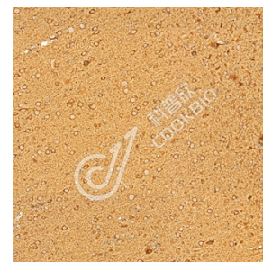
IHC 检测 MVD 蛋白(货号 K1345249). 样品: 大鼠脑, 4%多聚甲醛 (货号 KSG1101) 固定 12-24 小时. 抗原修复: Tris-EDTA 抗原修复液(pH 9.0) (KSG1203), 98°C, 20 分钟. 一抗: 1: 1300 稀释, 4°C 孵育过夜. 二抗: S-vision 免疫组化多聚二抗(山羊抗兔), 即用型 (货号 KB3906), 室温孵育 20 分钟.