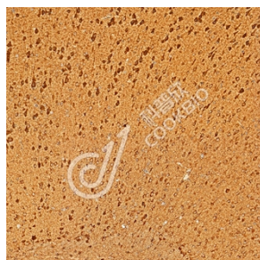
IHC 检测 MVD 蛋白(货号 K1345249). 样品: 小鼠脑, 4%多聚甲醛 (货号 KSG1101) 固定 12-24 小时. 抗原修复: Tris-EDTA 抗原修复液(pH 9.0) (KSG1203), 98°C, 20 分钟. 一抗: 1: 1300 稀释, 4°C 孵育过夜. 二抗: S-vision 免疫组化多聚二抗(山羊抗兔), 即用型 (货号 KB3906), 室温孵育 20 分钟.