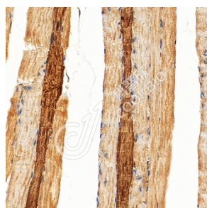
IHC 检测 GLUT12 蛋白(货号 K1345423). 样品: 大鼠骨骼肌, 4%多聚甲醛 (货号 KSG1101) 固定 12-24 小时. 抗原修复: Tris-EDTA 抗原修复液(pH 9.0) (KSG1203), 98°C, 20 分钟. 一抗: 1: 1300 稀释, 4°C 孵育过夜. 二抗: S-vision 免疫组化多聚二抗(山羊抗兔), 即用型 (货号 KB3906), 室温孵育 20 分钟.