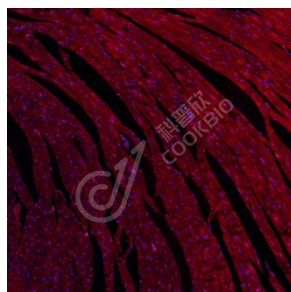
IF 检测 RhoA + RhoC 蛋白(货号 K1345528)(红色)。 样品: 小鼠心, 4%多聚甲醛 (货号 KSG1101) 固定 12-24 小时。 抗原修复: Tris-EDTA 抗原修复液(pH 9.0) (KSG1203), 98°C, 20 分钟。 封闭: 3% BSA (货号 KSGC305010) 的 PBS 溶液, 室温孵育 30 分钟。 一抗: 1: 600 稀释, 4°C 孵育过夜。 二抗: Cy3 标记山羊抗兔 IgG (H+L) (货号 KB63909), 1: 300 稀释, 室温孵育 1 小时。