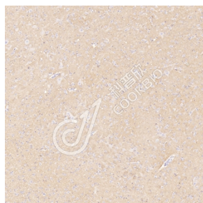
IHC 检测 GAP43 蛋白(货号 K545285). 样品: 大鼠脑, 4%多聚甲醛 (货号 KSG1101) 固定 12-24 小时。 抗原修复: 柠檬酸抗原修复液(干粉, pH 6.0) (KSG1201), 高压锅均匀喷气计时 2 分钟。 一抗: 1: 800 稀释, 4°C 孵育过夜。 二抗: S-vision 免疫组化多聚二抗(山羊抗小鼠), 即用型(货号 KB3903), 室温孵育 20 分钟。