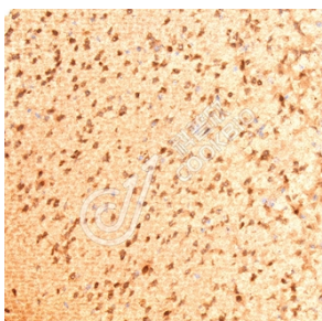
IHC 检测 RIMS3 蛋白(货号 K1346053). 样品: 小鼠脑, 4%多聚甲醛 (货号 KSG1101) 固定 12-24 小时. 抗原修复: Tris-EDTA 抗原修复液(pH 9.0) (KSG1203), 98°C, 20 分钟. 一抗: 1: 1500 稀释, 4°C 孵育过夜. 二抗: S-vision 免疫组化多聚二抗(山羊抗兔), 即用型 (货号 KB3906), 室温孵育 20 分钟.