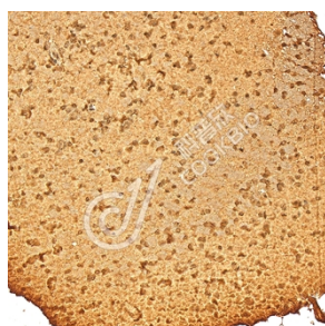
IHC 检测 TIP-1 蛋白(货号 K1346158). 样品: 小鼠脑, 4%多聚甲醛 (货号 KSG1101) 固定 12-24 小时. 抗原修复: Tris-EDTA 抗原修复液(pH 9.0) (KSG1203), 98°C, 20 分钟. 一抗: 1: 1000 稀释, 4°C 孵育过夜. 二抗: S-vision 免疫组化多聚二抗(山羊抗兔), 即用型 (货号 KB3906), 室温孵育 20 分钟.