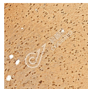
IHC 检测 TIP-1 蛋白(货号 K1346158). 样品: 大鼠脑, 4%多聚甲醛 (货号 KSG1101) 固定 12-24 小时. 抗原修复: Tris-EDTA 抗原修复液(pH 9.0) (KSG1203), 98°C, 20 分钟. 一抗: 1: 1000 稀释, 4°C 孵育过夜. 二抗: S-vision 免疫组化多聚二抗(山羊抗兔), 即用型 (货号 KB3906), 室温孵育 20 分钟.