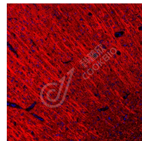
IF 检测 MAP2 蛋白(货号 K1346677)(红色). 样品: 大鼠脑, 4%多聚甲醛 (货号 KSG1101) 固定 12-24 小时. 抗原修复: Tris-EDTA 抗原修复液(pH 9.0) (KSG1203), 98°C, 20 分钟. 封闭: 3% BSA (货号 KSGC305010) 的 PBS 溶液, 室温孵育 30 分钟. 一抗: 1: 800 稀释, 4°C 孵育过夜. 二抗: Cy3 标记山羊抗兔 IgG (H+L) (货号 KB63909), 1: 300 稀释, 室温孵育 1 小时.