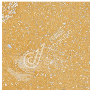
IHC 检测 NCAM1 蛋白(货号 K5450357). 样品: 大鼠海马区, 4%多聚甲醛 (货号 KSG1101) 固定 12-24 小时. 抗原修复: Tris-EDTA 抗原修复液(pH 9.0) (货号 KSG1203), 水浴 100°C, 25 分钟. 一抗: 1: 800 稀释, 4°C 孵育过夜. 二抗: S-vision 免疫组化多聚二抗(山羊抗兔),即用型 (货号 KB3906), 室温孵育 20 分钟.