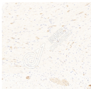
IHC 检测 nNOS 蛋白(货号 K133435). 样品: 人结肠, 4%多聚甲醛 (货号 KSG1101) 固定 12-24 小时. 抗原修复: 柠檬酸抗原修复液(干粉, pH 6.0) (KSG1201), 98°C, 20 分钟. 一抗: 1: 600 稀释, 4°C 孵育过夜. 二抗: S-visualization 多聚二抗(山羊抗兔), 即用型 (货号 KB3906), 室温孵育 20 分钟.