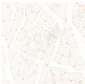
IHC 检测 Thyrotroph embryonic factor 蛋白(货号 K1334959). 样品: 小鼠骨骼肌, 4%多聚甲醛 (货号 KSG1101) 固定 12-24 小时. 抗原修复: Tris-EDTA 抗原修复液(pH 9.0) (KSG1203), 98°C, 20 分钟. 一抗: 1: 900 稀释, 4°C 孵育过夜. 二抗: S-vision 免疫组化多聚二抗(山羊抗兔),即用型 (货号 KB3906), 室温孵育 20 分钟.