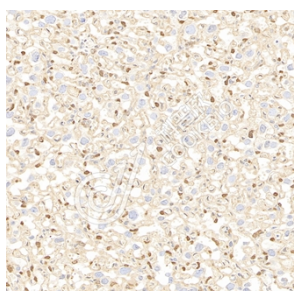
IHC 检测 TAZ 蛋白(货号 K1335259). 样品: 小鼠胎盘, 4%多聚甲醛 (货号 KSG1101) 固定 12-24 小时. 抗原修复: 柠檬酸抗原修复液(干粉, pH 6.0) (KSG1201), 98°C, 20 分钟. 一抗: 1: 1100 稀释, 4°C 孵育过夜. 二抗: S-vision 免疫组化多聚二抗(山羊抗兔), 即用型 (货号 KB3906), 室温孵育 20 分钟.