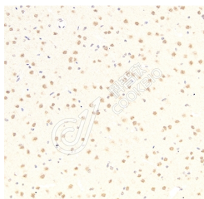
IHC 检测 hnRNP F+H 蛋白(货号 K1336357). 样品: 小鼠脑, 4%多聚甲醛 (货号 KSG1101) 固定 12-24 小时. 抗原修复: Tris-EDTA 抗原修复液(pH 9.0) (KSG1203), 98°C, 20 分钟. 一抗: 1: 2300 稀释, 4°C 孵育过夜. 二抗: S-vision 免疫组化多聚二抗(山羊抗兔), 即用型 (货号 KB3906), 室温孵育 20 分钟.