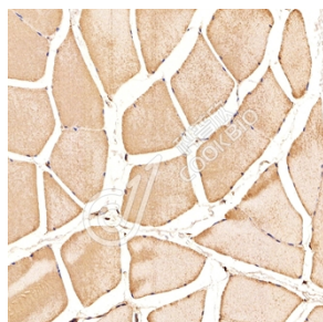
IHC 检测 SLC8A3 蛋白(货号 K1339606). 样品: 大鼠骨骼肌, 4%多聚甲醛 (货号 KSG1101) 固定 12-24 小时. 抗原修复: 柠檬酸抗原修复液(干粉, pH 6.0) (KSG1201), 98°C, 20 分钟. 一抗: 1: 1200 稀释, 4°C 孵育过夜. 二抗: S-vision 免疫组化多聚二抗(山羊抗兔), 即用型 (货号 KB3906), 室温孵育 20 分钟.