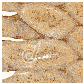
IHC 检测 24p3R 蛋白(货号 K1345003). 样品: 小鼠睾丸, 4%多聚甲醛 (货号 KSG1101) 固定 12-24 小时。 抗原修复: Tris-EDTA 抗原修复液(pH 9.0) (KSG1203), 98°C, 20 分钟。 一抗: 1: 1600 稀释, 4°C 孵育过夜。 二抗: S-vision 免疫组化多聚二抗(山羊抗兔), 即用型 (货号 KB3906), 室温孵育 20 分钟。