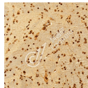
IHC 检测 HNRPH2/HNRNPH2 蛋白(货号 K1345015). 样品: 大鼠脑, 4%多聚甲醛 (货号 KSG1101) 固定 12-24 小时. 抗原修复: Tris-EDTA 抗原修复液(pH 9.0) (KSG1203), 98°C, 20 分钟. 一抗: 1: 1300 稀释, 4°C 孵育过夜. 二抗: S-vision 免疫组化多聚二抗(山羊抗兔), 即用型 (货号 KB3906), 室温孵育 20 分钟.