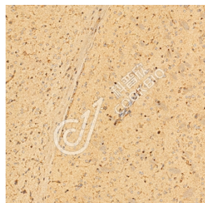
IHC 检测 VRK2 蛋白(货号 K1345258). 样品: 小鼠脑, 4%多聚甲醛 (货号 KSG1101) 固定 12-24 小时. 抗原修复: Tris-EDTA 抗原修复液(pH 9.0) (KSG1203), 98°C, 20 分钟. 一抗: 1: 1300 稀释, 4°C 孵育过夜. 二抗: S-vision 免疫组化多聚二抗(山羊抗兔), 即用型 (货号 KB3906), 室温孵育 20 分钟.