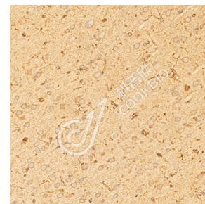
IHC 检测 VRK2 蛋白(货号 K1345258). 样品: 大鼠脑, 4%多聚甲醛 (货号 KSG1101) 固定 12-24 小时. 抗原修复: Tris-EDTA 抗原修复液(pH 9.0) (KSG1203), 98°C, 20 分钟. 一抗: 1: 1300 稀释, 4°C 孵育过夜. 二抗: S-vision 免疫组化多聚二抗(山羊抗兔), 即用型 (货号 KB3906), 室温孵育 20 分钟.