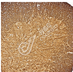
IHC 检测 HNT 蛋白(货号 K1345408). 样品: 小鼠脊髓, 4%多聚甲醛 (货号 KSG1101) 固定 12-24 小时. 抗原修复: Tris-EDTA 抗原修复液(pH 9.0) (KSG1203), 98°C, 20 分钟. 一抗: 1: 1300 稀释, 4°C 孵育过夜. 二抗: S-vision 免疫组化多聚二抗(山羊抗兔), 即用型 (货号 KB3906), 室温孵育 20 分钟.