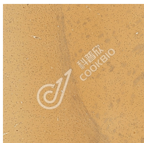
IHC 检测 ANKRD37 蛋白(货号 K1345594). 样品: 大鼠脑, 4%多聚甲醛 (货号 KSG1101) 固定 12-24 小时. 抗原修复: Tris-EDTA 抗原修复液(pH 9.0) (KSG1203), 98°C, 20 分钟. 一抗: 1: 1400 稀释, 4°C 孵育过夜. 二抗: S-vision 免疫组化多聚二抗(山羊抗兔),即用型 (货号 KB3906), 室温孵育 20 分钟.