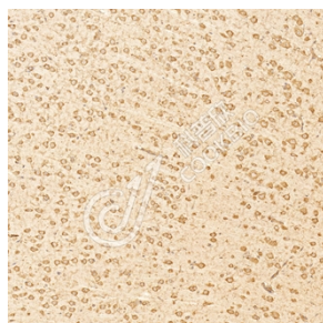
IHC 检测 IL-1RAPL1 蛋白(货号 K1345738). 样品: 大鼠脑, 4%多聚甲醛 (货号 KSG1101) 固定 12-24 小时. 抗原修复: Tris-EDTA 抗原修复液(pH 9.0) (KSG1203), 98°C, 20 分钟. 一抗: 1: 1500 稀释, 4°C 孵育过夜. 二抗: S-vision 免疫组化多聚二抗(山羊抗兔), 即用型 (货号 KB3906), 室温孵育 20 分钟.