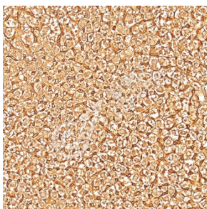
IHC 检测 Protein FAM131B 蛋白(货号 K1345921). 样品: 小鼠肝, 4%多聚甲醛 (货号 KSG1101) 固定 12-24 小时. 抗原修复: Tris-EDTA 抗原修复液(pH 9.0) (KSG1203), 98°C, 20 分钟. 一抗: 1: 1400 稀释, 4°C 孵育过夜. 二抗: S-vision 免疫组化多聚二抗(山羊抗兔), 即用型 (货号 KB3906), 室温孵育 20 分钟.