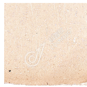
IHC 检测 Synaptophysin 蛋白(货号 K238442). 样品: 大鼠脑, 4%多聚甲醛 (货号 KSG1101) 固定 12-24 小时. 抗原修复: 柠檬酸抗原修复液(干粉, pH 6.0) (KSG1201), 高压锅均匀喷气计时 2 分钟. 一抗: 1: 1000 稀释, 4°C 孵育过夜. 二抗: S-vision 免疫组化多聚二抗(山羊抗小鼠), 即用型 (货号 KB3903), 室温孵育 20 分钟.