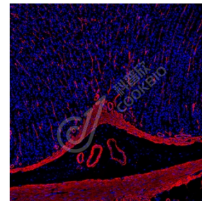
IF 检测 alpha smooth muscle Actin 蛋白(货号 K545132)(红色) 样品：大鼠胃, 4%多聚甲醛 (货号 KSG1101) 固定 12-24 小时。 抗原修复: Tris-EDTA 抗原修复液(pH 9.0) (货号 KSG1203), 水浴 100°C, 25 分钟。 封闭: 3% BSA (货号 KSGC305010) 的 PBS 溶液, 室温孵育 30 分钟。 一抗: 1: 1500 稀释, 4°C 孵育过夜。 二抗: Cy3 标记山羊抗兔 IgG (H+L) (货号 KB63909), 1: 300 稀释, 室温孵育 1 小时。